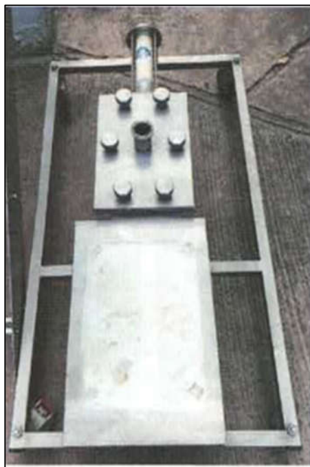
ITEM 1,001 - VISTA DO BOMBA HELICOIDAL DE TRANSFERENCIA MARCA: NETZSCH SEM MOTORIZACAO