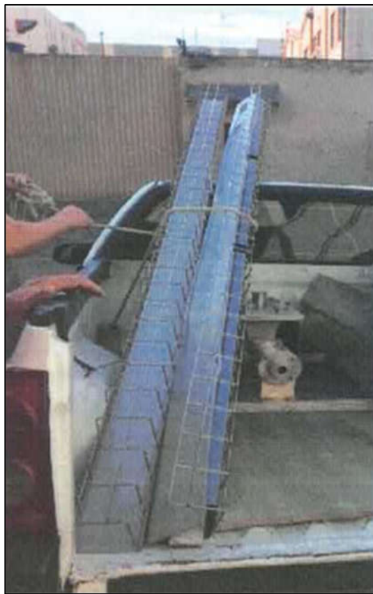
ITEM 1,004 - VISTA DOS SUPORTES METÁLICOS PARA MANGUEIRAS PNEUMÁTICAS DOS DOSADORES