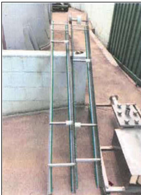
ITEM 1,004 - VISTA DOS ITENS DIVERSOS: BASE DE ESTEIRA TRANSPORTADORA ALIMENTÍCIA SEM MOTORIZAÇÃO E SUPORTES