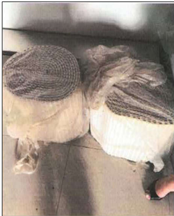
ITEM 1,003 - VISTA DAS CORREIAS DE ESTEIRA TRANSPORTADORA ALIMENTÍCIA