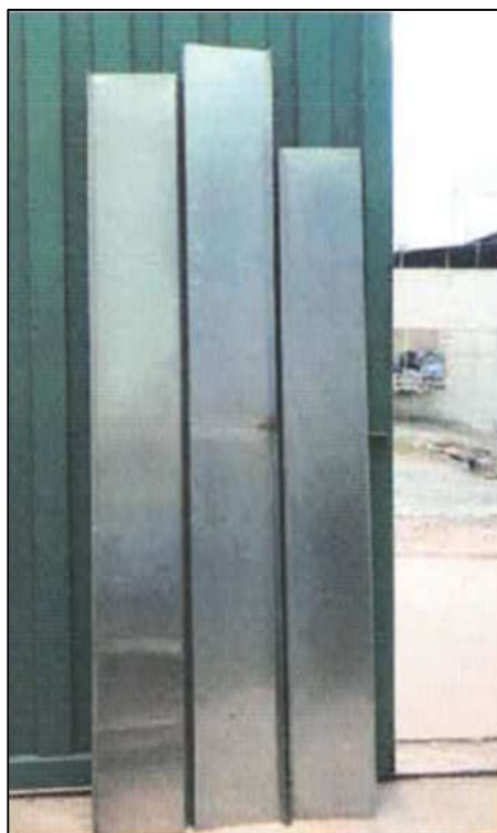
ITEM 1,004 - VISTA DOS ITENS DIVERSOS: SUPORTE PARA ESTEIRA TRANSPORTADORA (CHAPAS)