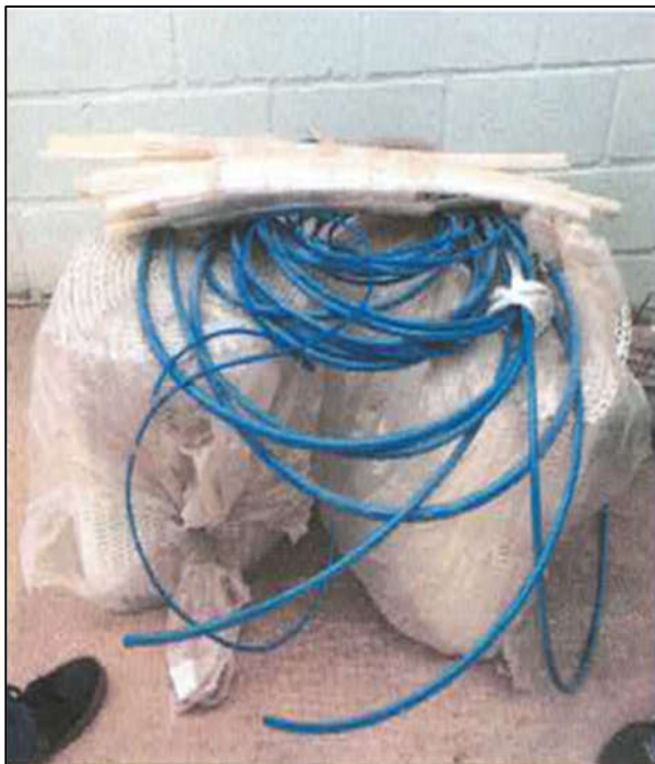
ITEM 1,002 - VISTA DA MANGUEIRA PARA LINHA DE AR COMPRIMIDO