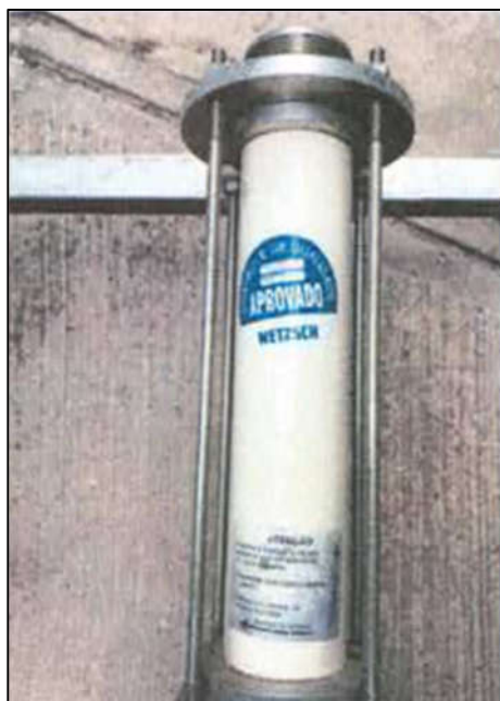
ITEM 1,001 - VISTA DO BOMBA HELICOIDAL DE TRANSFERENCIA MARCA: NETZSCH SEM MOTORIZACAO