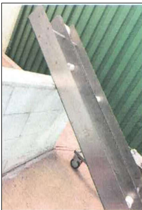
ITEM 1,004 - VISTA DOS ITENS DIVERSOS: BASE DE ESTEIRA TRANSPORTADORA ALIMENTÍCIA SEM MOTORIZAÇÃO E SUPORTES