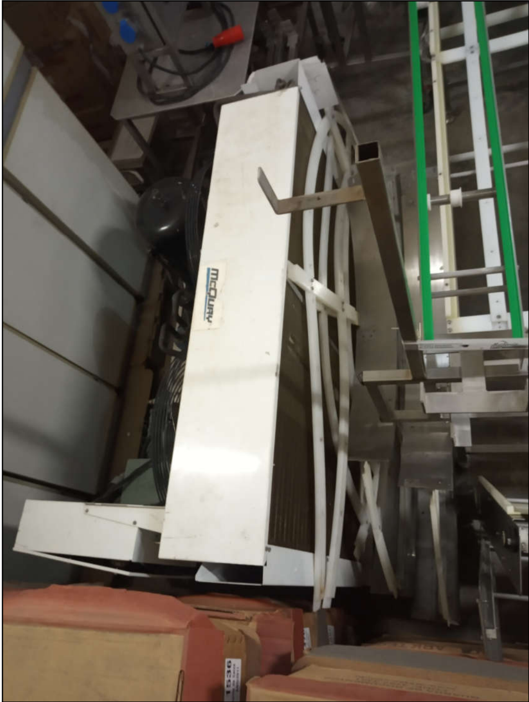
ITEM 1,002 - VISTA DO CONDENSADOR MCQUAY