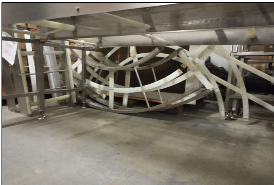
ITEM 1,001 - VISTA DAS ESTRUTURAS DAS ESTEIRAS EM AÇO INOX