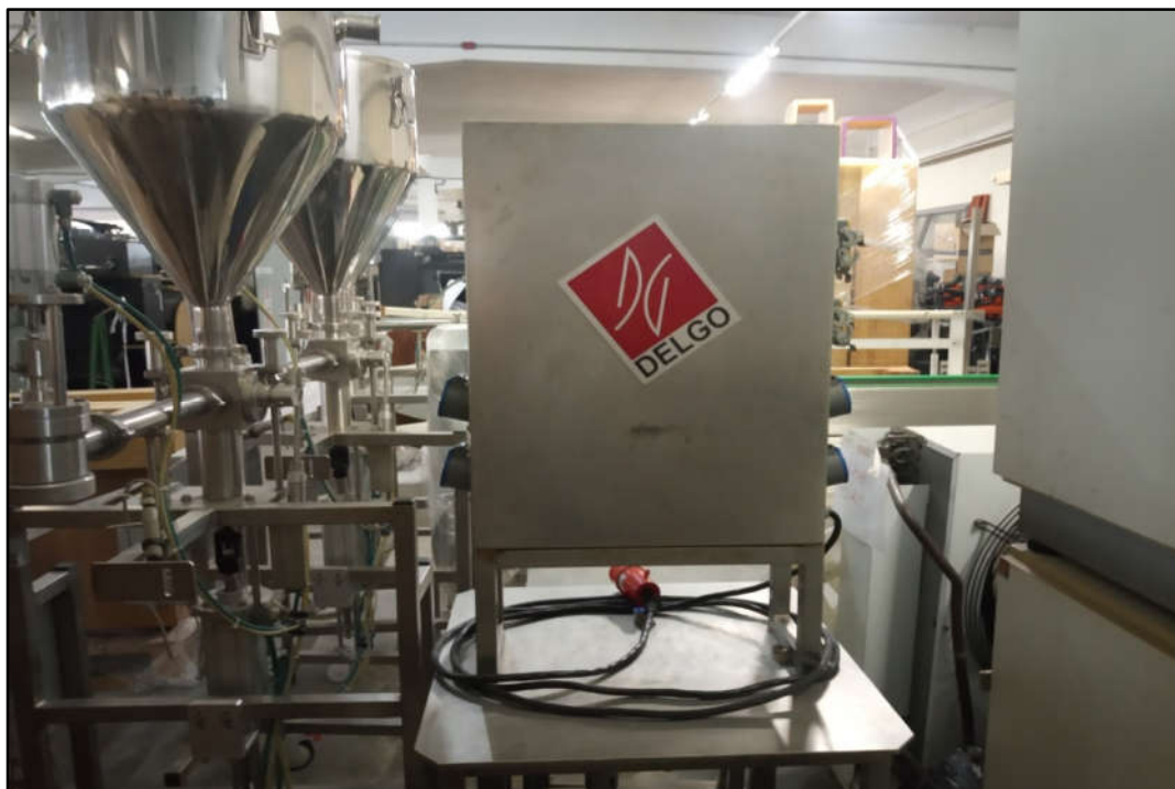
ITEM 1,001 - VISTA DO PAINÉLDE COMANDO MARCA: DELGO SCHNEIDER