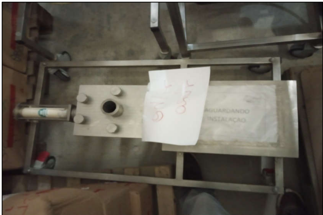
ITEM 1,001 - VISTA DA CONEXÃO DOS DOSADORES