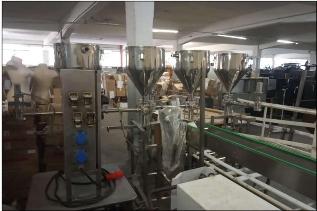
ITEM 1,001 - VISTA DOS 4 DOSADORES DA MARCA DELGO TIPO: DG451