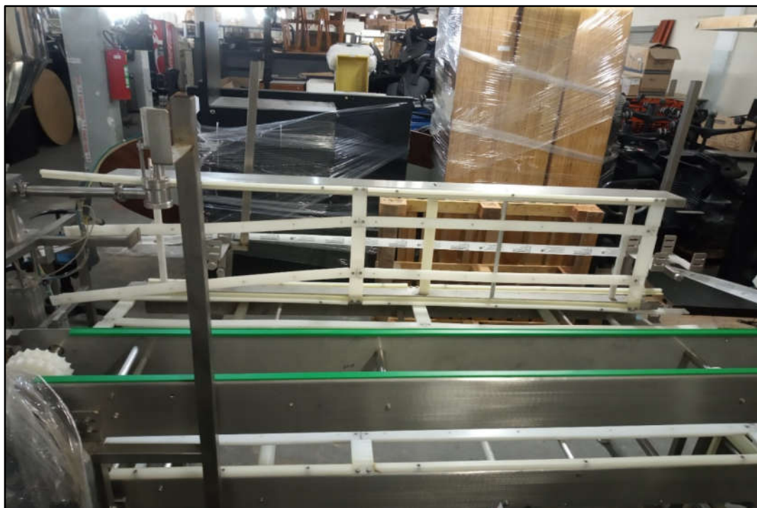
ITEM 1,001 - VISTA DAS ESTRUTURAS DAS ESTEIRAS EM AÇO INOX