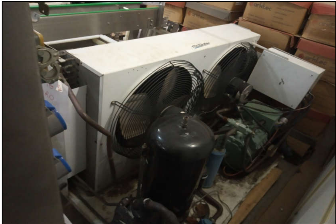
ITEM 1,002 - VISTA DO CONDENSADOR MCQUAY