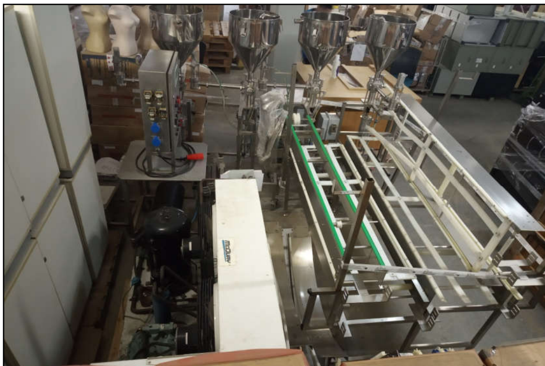
ITEM 1,001 - VISTA DA LINHA DE PRODUÇÃO DE MASSA PRONTA COMPREENDENDO: 4 DOSADORES MARCA DELGO TIPO: DG451, 1 PAINÉL DE COMANDO MARCA: DELGO SCHNEIDER, ESTRUTURA DE ESTEIRA DE AÇO INOX COM 3 MÓDULOS RETOS E 1 CURVA