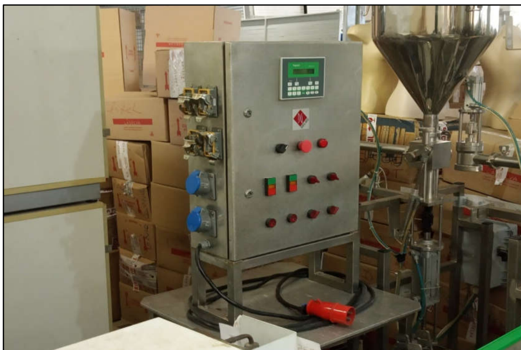
ITEM 1,001 - VISTA DO PAINÉL DE COMANDO MARCA: DELGO SCHNEIDER