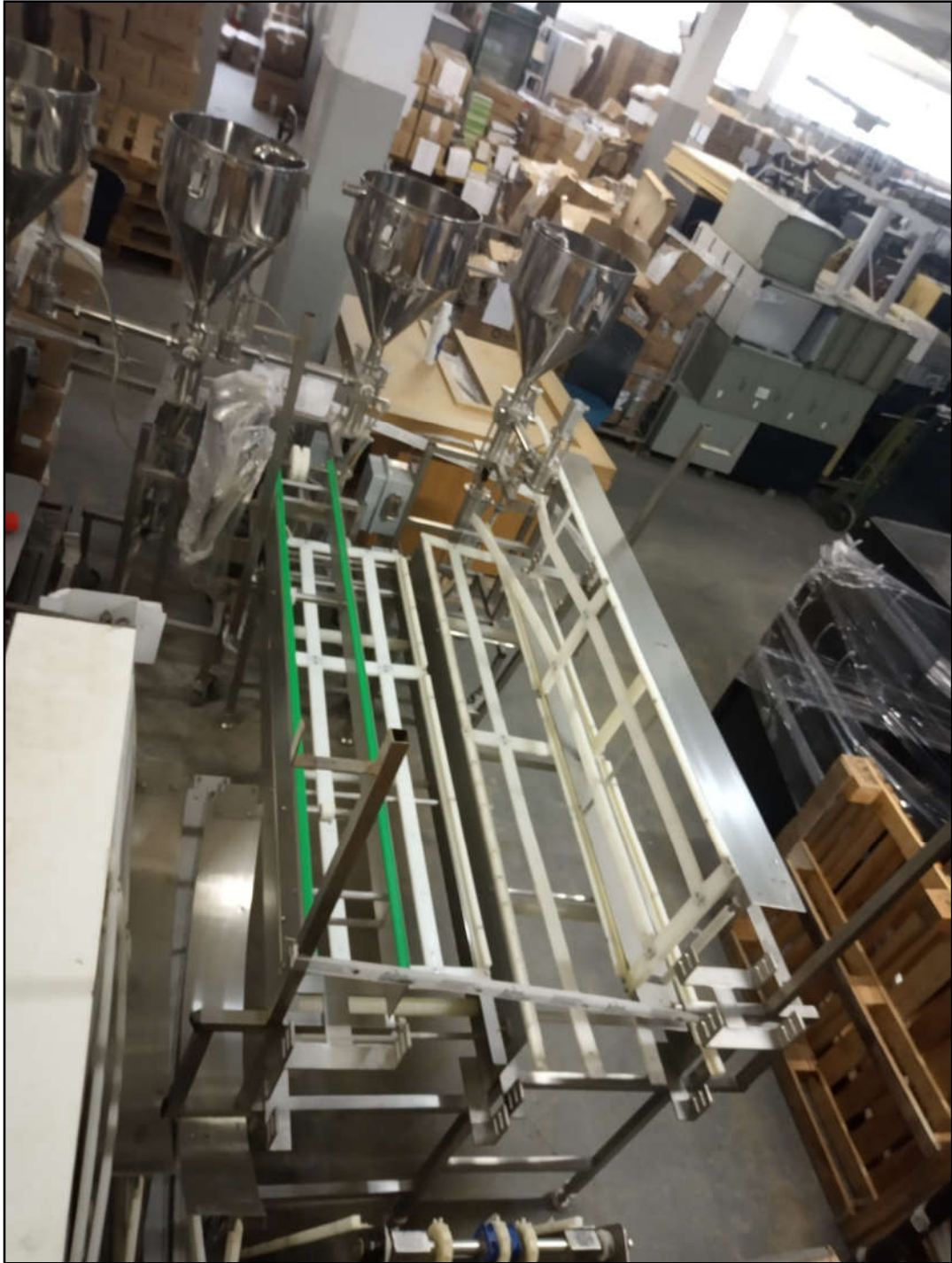
ITEM 1,001 - VISTA DAS ESTRUTURAS DAS ESTEIRAS EM AÇO INOX