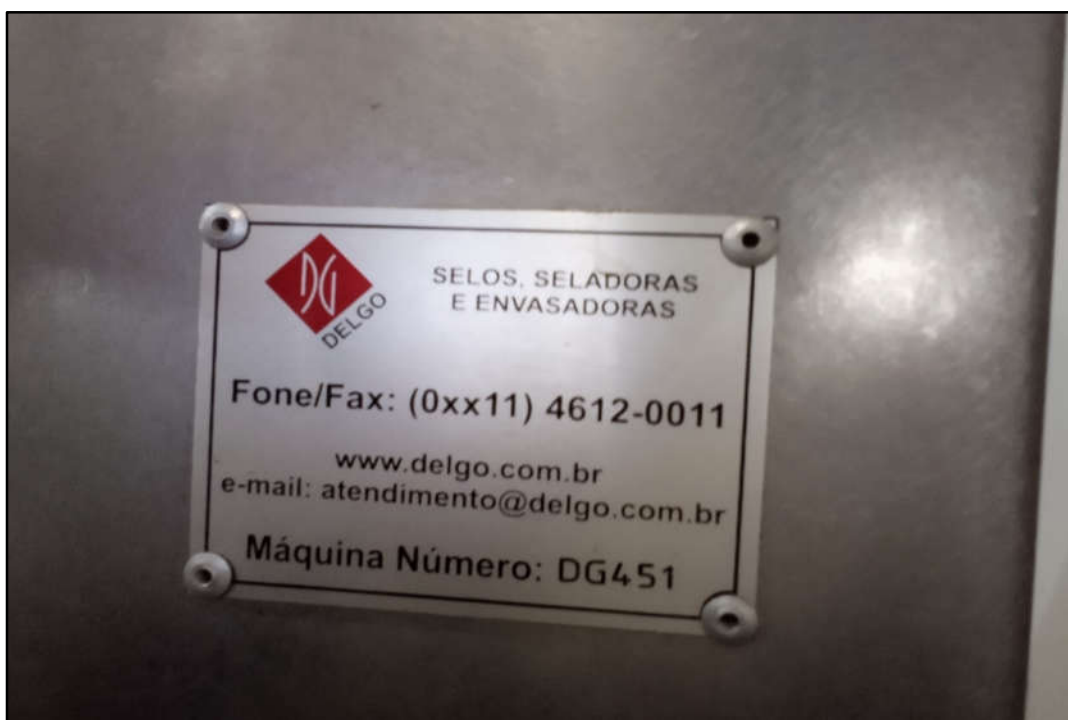
ITEM 1,001 - VISTA DA PLACA DE IDENTIFICAÇÃO DO ITEM 1,001 - VISTA DO PAINÉLDE COMANDO MARCA: DELGO SCHNEIDER